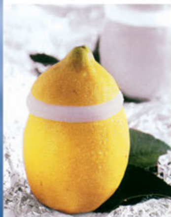
Limone € 5,00