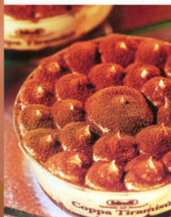
Tiramisù € 5,00