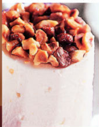
Torroncino € 5,00