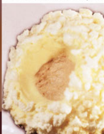
Tartufo bianco € 5,00