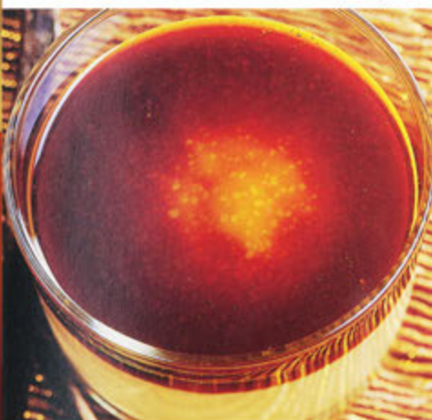
Crema Catalana € 5,00