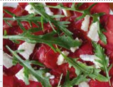
BRESAOLA RUCOLA E GRANA